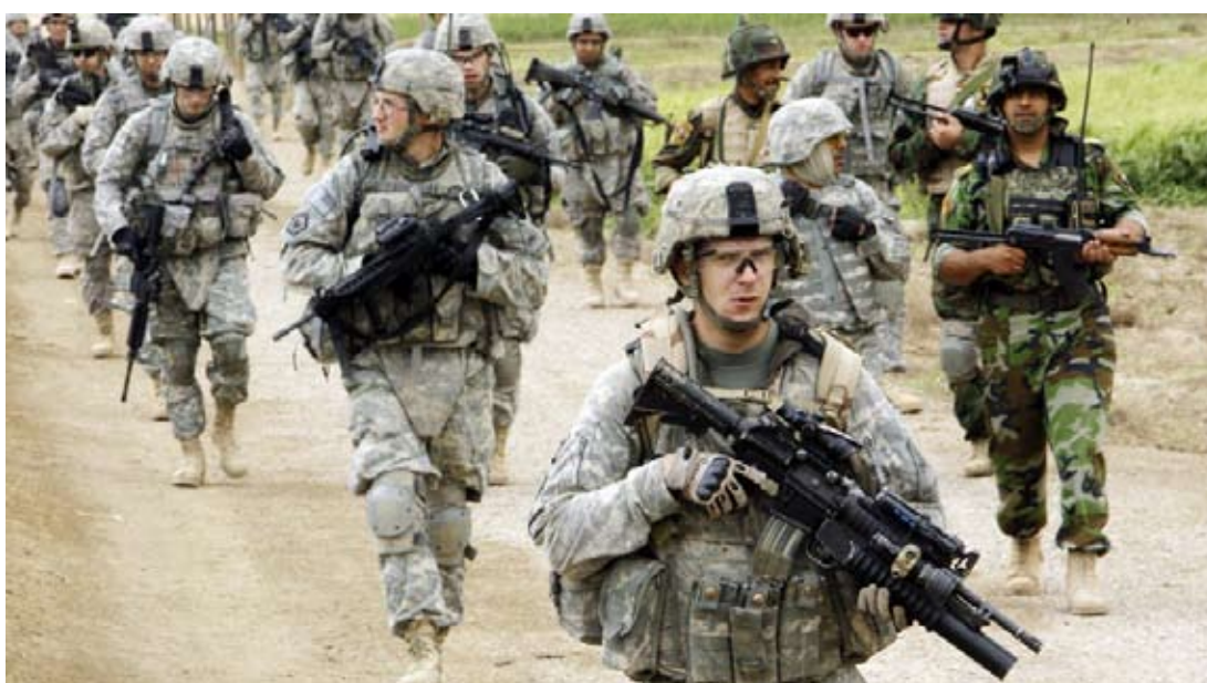
ئا: لاپەرى عیراق