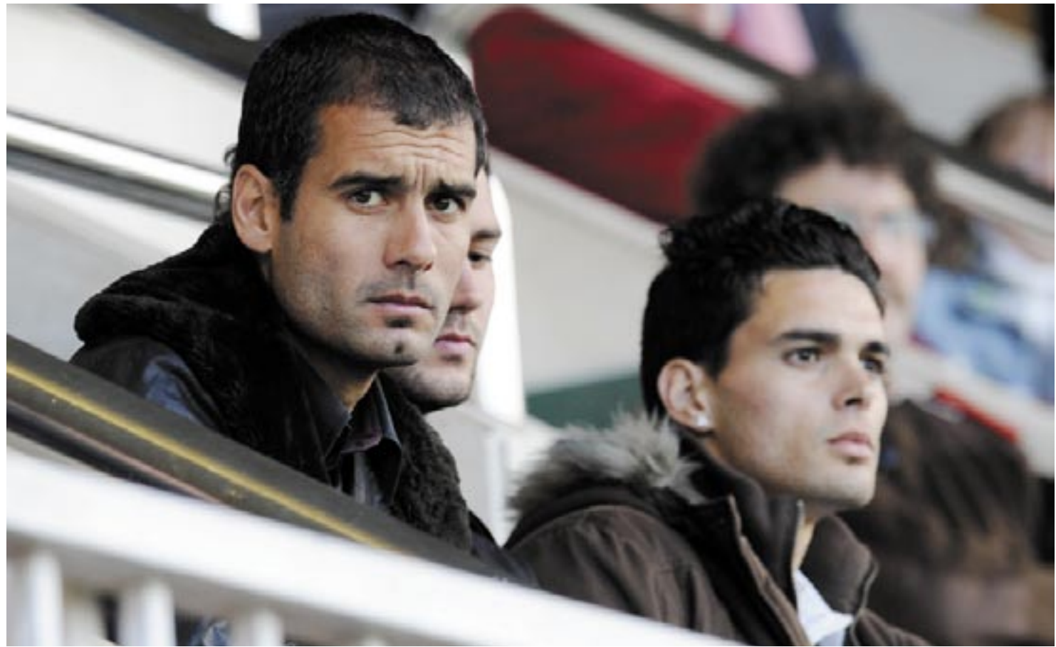
گوارديولا لەساتى ئامادەبوونى يارىيەكى بەرشەلۆنە لەۋەزى رابىردوۋى خولى ئىسپاندا

سەرەتاي دەرەكوتن گوارديولا لە ۱۸ / ۲ / ۱۹۷۱ ھاتۆتە ژيانەو لە سان پىدرو كە نىزىكەى كاتمىسرو نىۋىك لە كەتەلۆنباۋە دوورە، لە تەمەنى تۆ سالىيەوہ شەيدايەكى سەرسەختى تۇپى