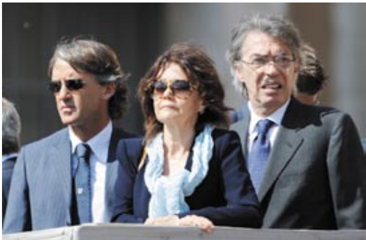
مۇراتى مانچىنى لەكاتى سەردانى پاپاي فائىكاندا

سەرەتاي روداۋەكانى: پاش ئەوہى لەقۇناغى ۱۶ى خولى يانە پالەوانەكاندا، يانەى ئىنتەر بەرامبەر لىقەرپول دۇپوا مائاۋاىسى كىرد، مانچىنى راھىنەرى يانەكە دەستى لەكار كىشەيەوہ . پاش رۆژىك لەم روداۋە، دواى ئەوہى لەگەل سەرۆكى يانەكە كۆبۈنەوہ، راھىنەرى لەم دەست لەكار كىشەنەوہيە پەشىمان بووہ . مانچىنى لەسەر كارەكەى ماپەوہ تاكۆتايى ئەم ۋەرزە، يەكشەممەى رابىردو بە دوا يارى جامى ئىتالىا كۆتايى بەيارىيەكانى يانەكە ھات . دواى تەواۋ بوونى ئەم يارى ھەموو رۆژنامە ئىتالىيەكان باسپان لەوہ كىرد كە مانچىنى لەسەر كارەكەى لادەبرىتۆ مۇرىنھۆ جىگەى دەگىرتەوہ . رۆژى سە شەممە كۆبۈنەوہى نىۋان مۇراتى سەرۆكى يانەكەو مانچىنى راھىنەرى ئەنجامدان، ئەم كۆبۈنەوہيە ۲۵ خولەكى خاياند . مانچىنى بە