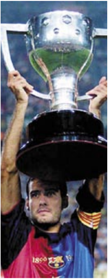
خولى ئىسپانى بەرئەدەكاتەوہ

گوارديولا لەگەل رۆپەرتۆ باجىردا لە يانەى برىشيا ئىدارەى يانەى بەرشە و ھاندەرانى تىپىك كە لەگەل ھاۋرىكانى كىردىان ۱۰ بە ۴ يارىيەكەيان بىردەوہ . لەم يارىيەدا گوارديولا ۹ گۆلى تۆماركرد، پاشان چوۋە تىپى مندالانى يانەى خىمناستىكاۋ دواتر لەسالى ۱۹۸۴ دا بەرشەلۆنە چاۋى خستەسەر، ئاستى سالى بە سال بەرەو پىشەوہ دەچو، تۋانى خۆى بگەيەنئىتە تىپى دوۋەمى بەرشە، لە ۲۶۳ يارى بۇ تىپى دوۋەمى بەرشە تۋانى ۶ گۆل تۆمارىكات، لە سالى ۱۹۹۰ يۇھان كرۇيف گوارديولاۋى ھىتايە يانەى يەكەمى بەرشە لەگەل ئەستىزەكانى يانەكە لاۋدروب، ستوتشكوف، زۇنالدى، رىفالدى، زوبىزارىتا، باكىرو، فىقو، رومارىف، ئامور، كويمان .